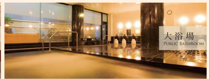
大浴場 PUBLIC BATHROOM