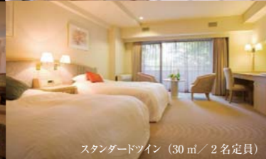
スタンダードツイン (30㎡ / 2名定員)