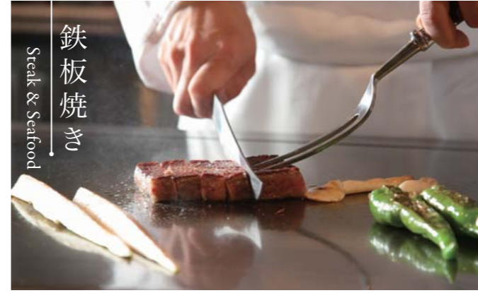
鉄板焼き Steak & Seafood