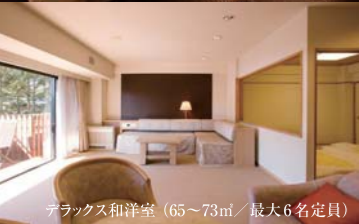
デラックス和洋室 (65~73㎡ / 最大6名定員)