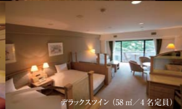
デラックスツイン (58㎡ / 4名定員)