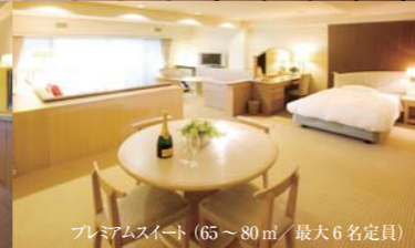
プレミアムスイート (65~80㎡ / 最大6名定員)