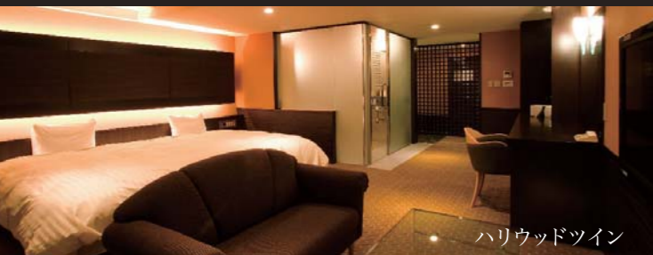
ハリウッドツイン