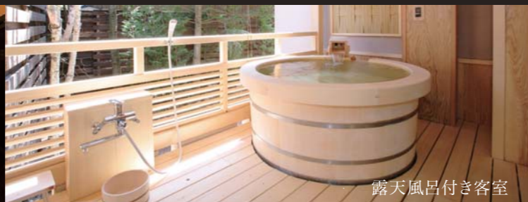
露天風呂付き客室